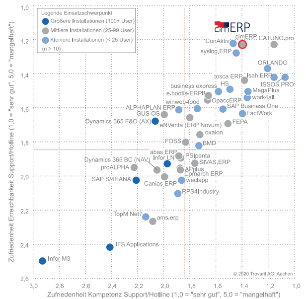
Zufriedenheitsportfolio „Kompetenz Support/Hotline vs. Erreichbarkeit Support/Hotline“

Seit über 35 Jahren sind wir Ihr Partner für flexibles ERP und optimale Produktionsplanung.